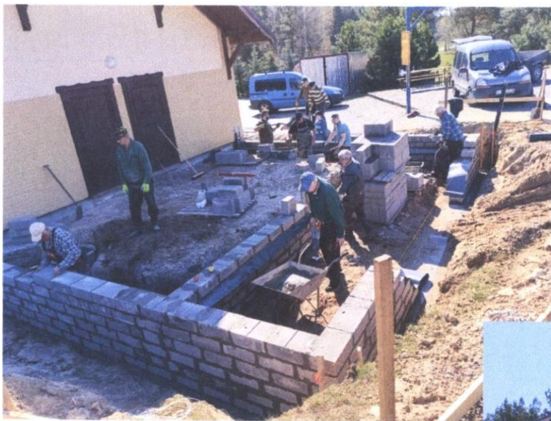
Prace budowlane przy rozbudowie świetlicy w Wysokiej

2. Zakończyliśmy rozbudowę świetlicy wiejskiej w Wysokiej. Po rozbudowie zwiększyła się powierzchnia budynku. Rozbudowa obejmowała rozbudowę sali głównej, powstanie pomieszczenia gospodarczego oraz toalety dla osób niepełnosprawnych, w sumie świetlica zwiększyła powierzchnię o 55 m 2 . Prace budowlane były wykonywane społecznie przez mieszkańców i lokalne firmy z sołectwa Wysoka oraz przez pracowników brygady remontowo – budowlanej Urzędu Gminy.