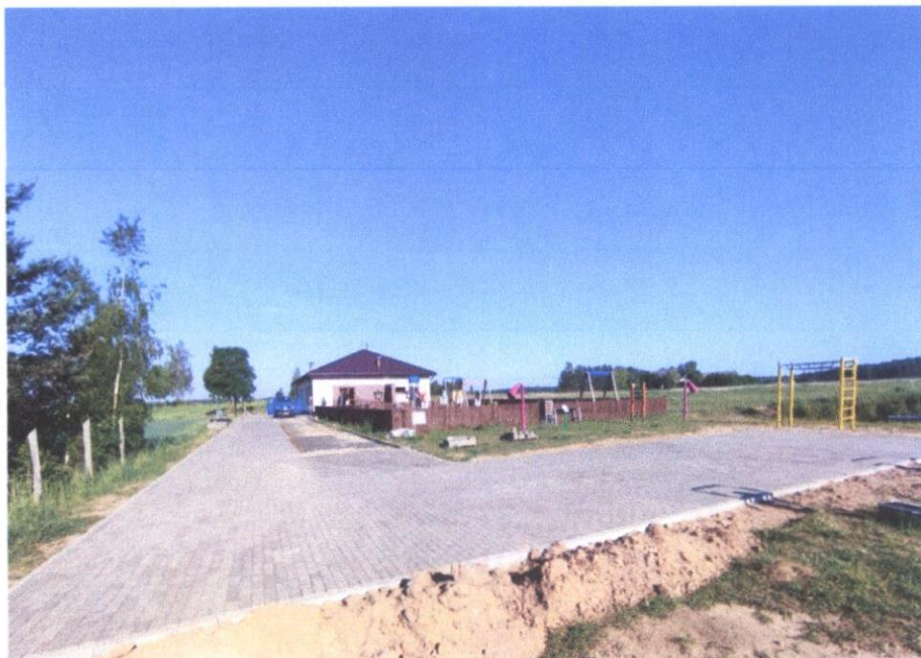
Utwardzony plac przy świetlicy wiejskiej i placu zabaw w Zalesiu.

6. Przy świetlicy wiejskiej w Zalesiu została położona kostka betonowa w ilości ok. 400 m 2 wszystkie prace, przy położeniu kostki, również wykonali pracownicy brygady remontowo – budowlanej.