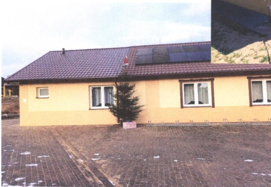
Budynek świetlicy wiejskiej w Wysokiej po rozbudowie.