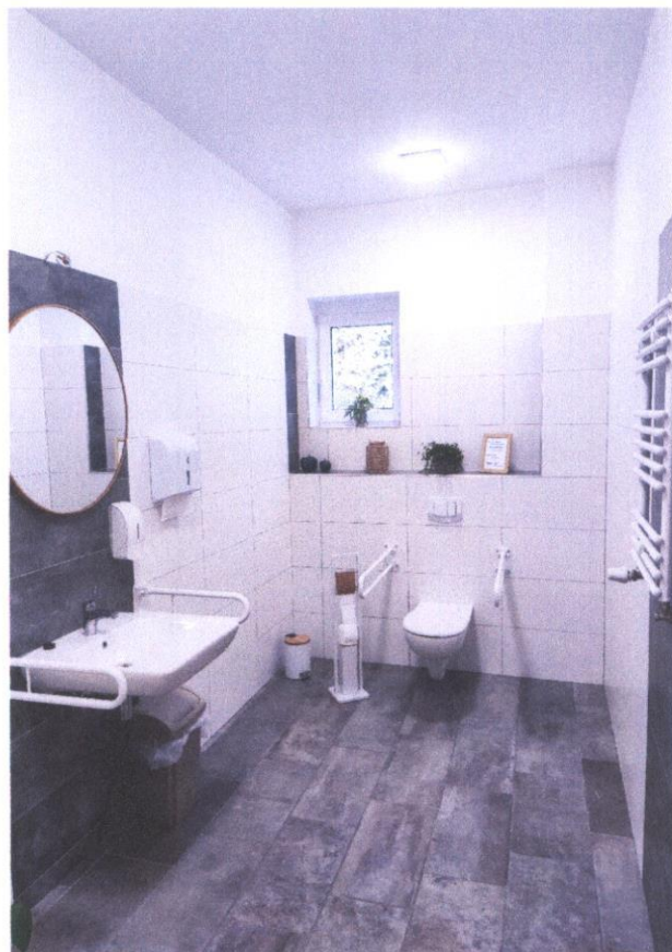
Korytarz i toaleta w świetlicy wiejskiej w Nowym Suminie.